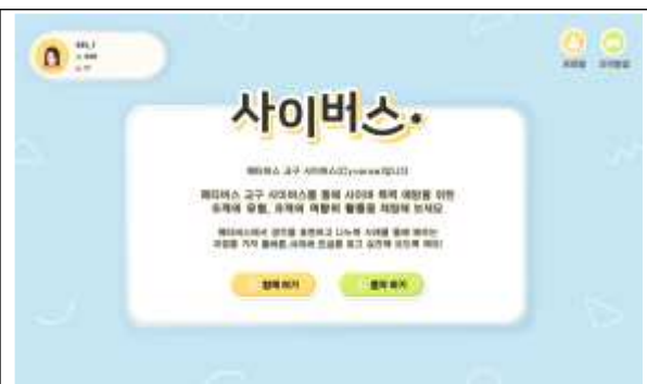
메타버스 대기실 화면