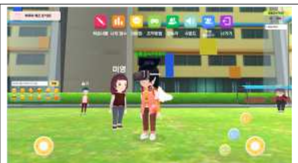
스테이지 미션 수행 화면